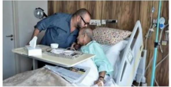
صورة ملته المغرب يقل رأس اليوسفي تلهب شبكات التواصل

الدكتور فيصل القاسم a partagé un lien. 13 min - €