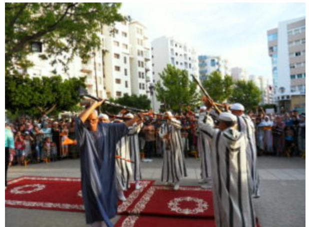
SAMSUNG DIGITAL CAMERA