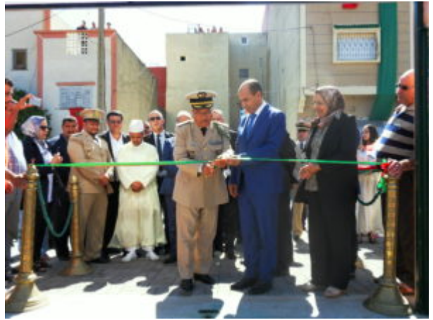
SAMSUNG DIGITAL CAMERA