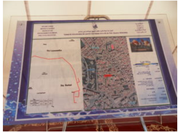
SAMSUNG DIGITAL CAMERA