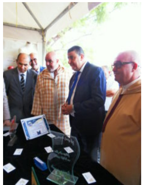
SAMSUNG DIGITAL CAMERA