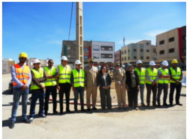
SAMSUNG DIGITAL CAMERA