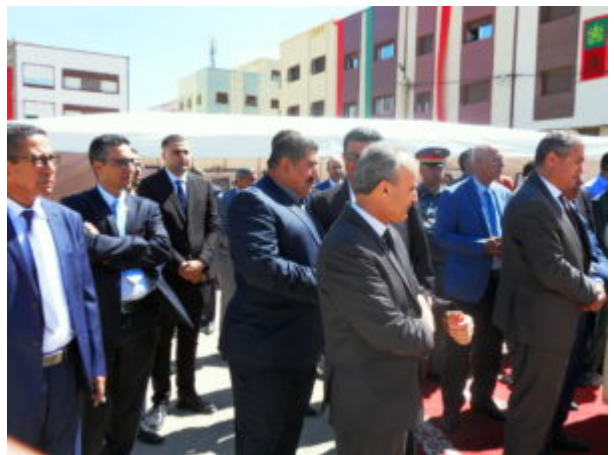
SAMSUNG DIGITAL CAMERA