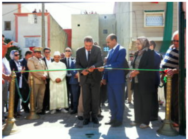
SAMSUNG DIGITAL CAMERA