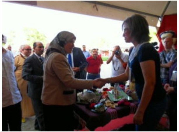
SAMSUNG DIGITAL CAMERA