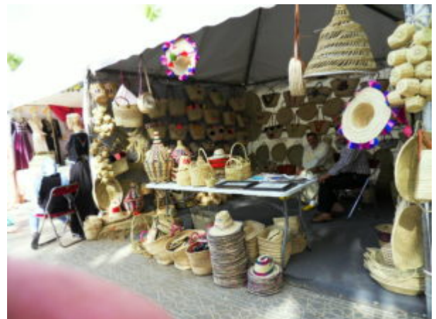
SAMSUNG DIGITAL CAMERA