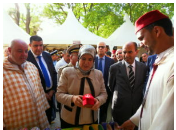
SAMSUNG DIGITAL CAMERA