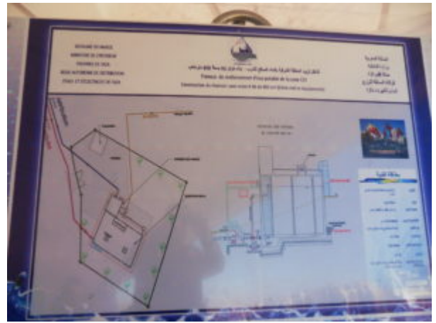
SAMSUNG DIGITAL CAMERA