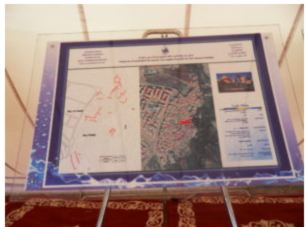
SAMSUNG DIGITAL CAMERA