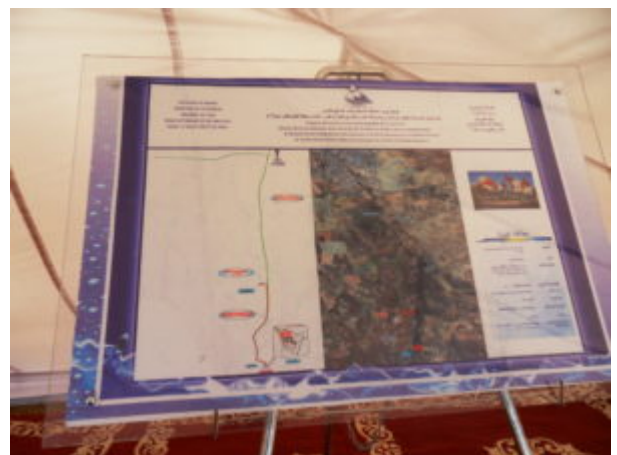
SAMSUNG DIGITAL CAMERA