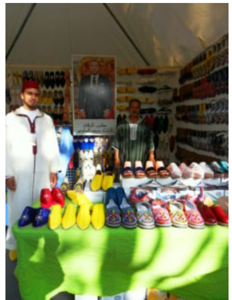
SAMSUNG DIGITAL CAMERA