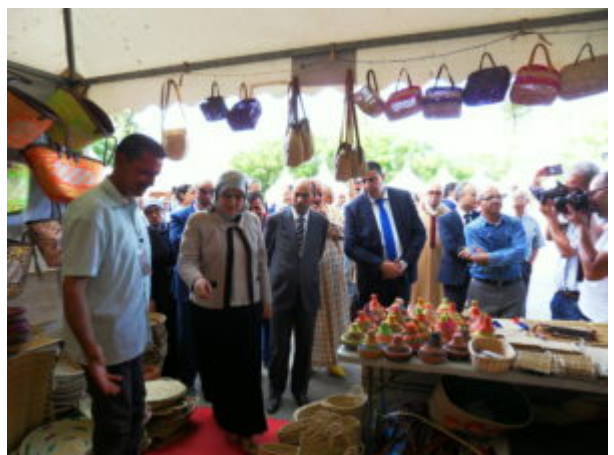
SAMSUNG DIGITAL CAMERA