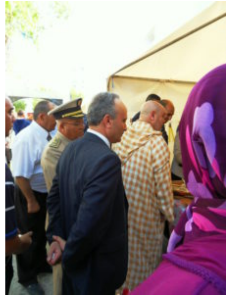
SAMSUNG DIGITAL CAMERA