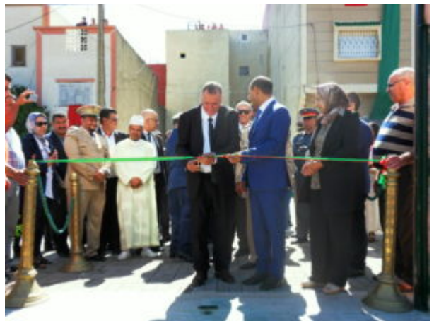
SAMSUNG DIGITAL CAMERA