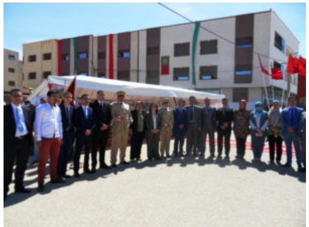
SAMSUNG DIGITAL CAMERA