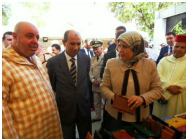
SAMSUNG DIGITAL CAMERA