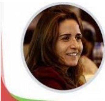
ليلى بنعلي وزارة الانتقال الطاقوي والتنمية المستدامة