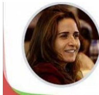
ليلى بنعلي وزارة الانتقال الطاقوي والتنمية المستدامة

وزيرة الطاقة ليلي بنعلي.. انطلاق مشاورات مع فاعلين إقليميين ودوليين لتوفير بديل للغاز الجزائري