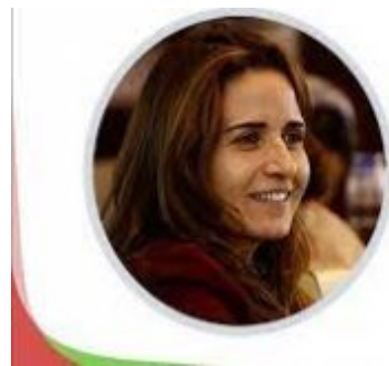
ليلى بنعلي وزارة الانتقال الطاقوي والتنمية المستدامة