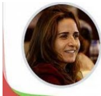
ليلى بنعلي وزارة الانتقال الطاقوي والتنمية المستدامة

وقرار السلطات الجزائرية بعدم تجديد العقد . جاء ذلك على لسان وزيرة الطاقة ليلي بنعلي، خلال جلسة عمومية خصصت للأسئلة الشفوية للسيدات والسادة البرلمانيين بمجلس النواب وقالت بنعلي إنّ وزارتها "باشرت مشاورات مع فاعلين على المستوى الإقليمي والجهوي والدولي، بهدف إرساء نظام دائم وناجع لتدبير إمدادات الغاز الطبيعي للمغرب". وكان المغرب يستفيد من الأنبوب الجزائري على شكل عائدات مالية كحقوق عبور، إضافة لكميات سنوية من الغاز الطبيعي تُستخدم في تشغيل محطتين لتوليد الكهرباء شمال وشرق البلاد. وقالت بنعلي إنّ الغاز الذي كان يحصل عليه المغرب من الجزائر عبر هذا الأنبوب "كان يُستعمل حصراً في محطتين لإنتاج الكهرباء، تاحضارت قرب طنجة (شمال)، وعين بني مطهر في المنطقة الشرقية". وأكدت أنّ "توقّف المحطتين، لم يؤثر على إنتاج الكهرباء في البلاد، نظراً لوجود منشآت أخرى لتوليد الطاقة". من جهة أخرى، توقّعت بنعلي ارتفاع إنتاج المملكة من الغاز الطبيعي إلى 110 ملايين متر مكعب هذا العام، من 98 مليون متر مكعب في 2020. وقالت الوزيرة: "هذه الكمية تُعتبر ضعيفة، مقارنة بالاستهلاك الوطني من الغاز الطبيعي، الذي يصل حالياً إلى مليار متر مكعب سنوياً .