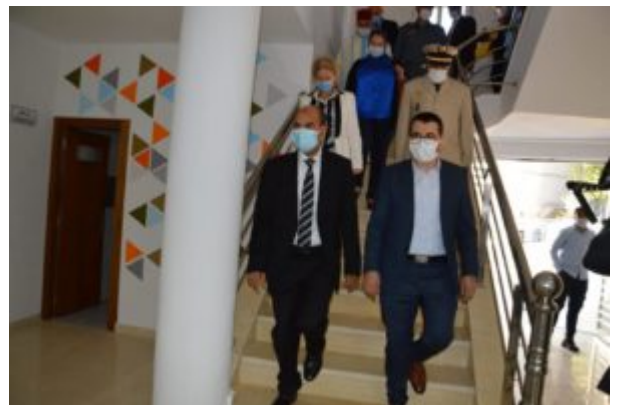
إفتتاح مقر منصة في إطار البرنامج الثالث للمبادرة الوطنية