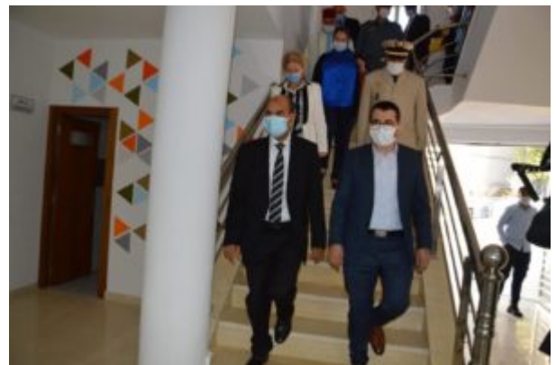
إفتتاح مقر منصة في إطار البرنامج الثالث للمبادرة الوطنية