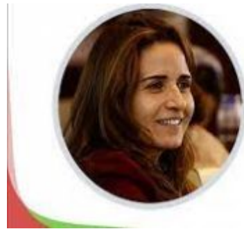
ليلي بنعلي وزارة الانتقال الطاقي والتنمية المستدامة