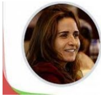
ليلي بنعلي وزارة الانتقال الطاقي والتنمية المستدامة

وقالت الوزيرة: "هذه الكمية تُعتبر ضعيفة، مقارنة بالاستهلاك الوطني من الغاز الطبيعي، الذي يصل حالياً إلى مليار متر مكعب سنوياً".