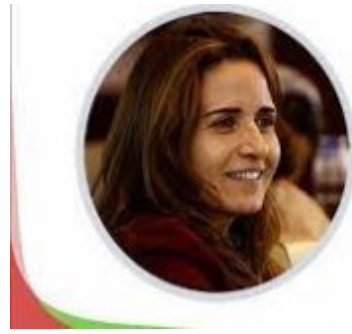
ليلى بنعلي وزارة الانتقال الطاقي والتنمية المستدامة

وزيرة الطاقة ليلي بنعلي.. انطلاق مشاورات مع فاعلين إقليميين ودوليين لتوفير بديل للغاز الجزائري