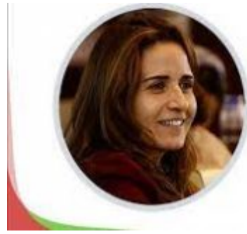
ليلى بنعلي وزارة الانتقال الطائفي والتنمية المستدامة