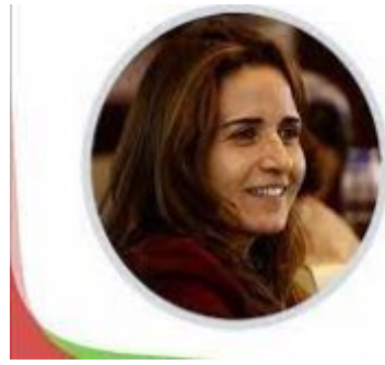
ليلى بنعلي وزارة الانتقال الطاقي والتنمية المستدامة