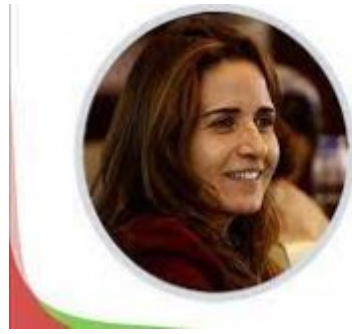
ليلى بنعلي وزارة الانتقال الطائفي والتنمية المستدامة